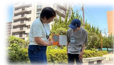
緊張しながら絵本を読みました 園児の皆さん楽しんでもらえて よかった〜!!