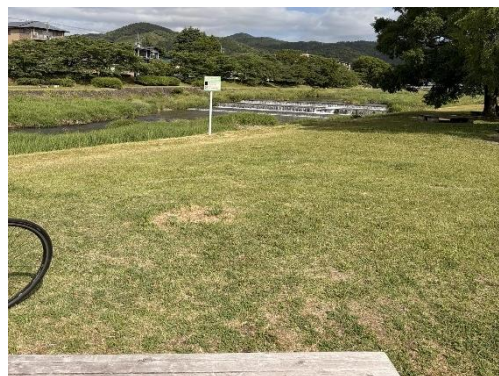
夏に備えて自宅近くの賀茂川河畔で肌慣れしています。

暑熱順化を早く済ませて、この夏に備えたいと思う5月下旬です。ではまた次号で…。(ま)