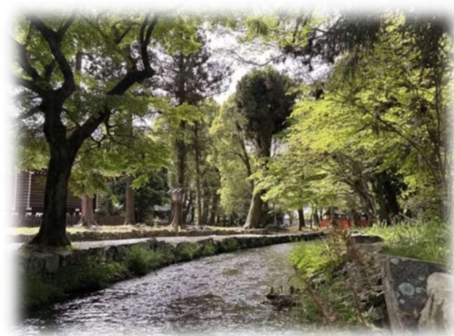
↑ 京都市賀茂神社の鮮やかな新緑